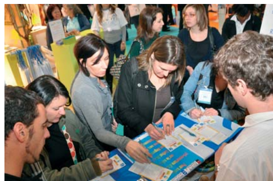
Une affluence record sur le stand de la BFM

Bien évidemment, nous ne manquerons pas de réitérer ce succès lors de la prochaine édition de cette manifestation devenue incontournable pour la BFM !